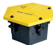
Elemento collegamento riscaldamento scambi Tipo 6400