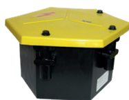
Point heating connection box Tipo 6400